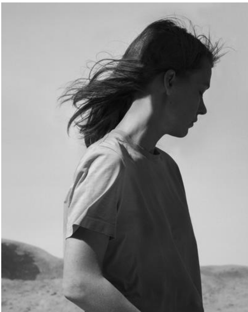
Landscape study. © Tom Callemin

Knap is ook de filminstallatie The circle and the square , die de teloorgang van de textielindustrie in Noordwest-Engeland oprakelt. De Britse en Pakistaanse gemeenschappen groeiden er uit elkaar. Maar hoe diep het sociale weefsel nog verankerd is, toont Suzanne Lacy in haar project waarbij de katoenfabriek voor drie dagen heroepend werd. Een collectieve zangsessie, een pleidooi voor meerstemmigheid in breedbeeld, vormt er het hoogtepunt van. Een filmproject dat in Leuven zal uitmonden in een workshop en een performance, is Sparks . Francesca Grilli keert er de traditionele verhoudingen in om en laat jongeren de toekomst van ouderen voorspellen. De volwassenen worden niet geacht commentaar te geven maar hun lot letterlijk in handen te geven van de volgende generaties.