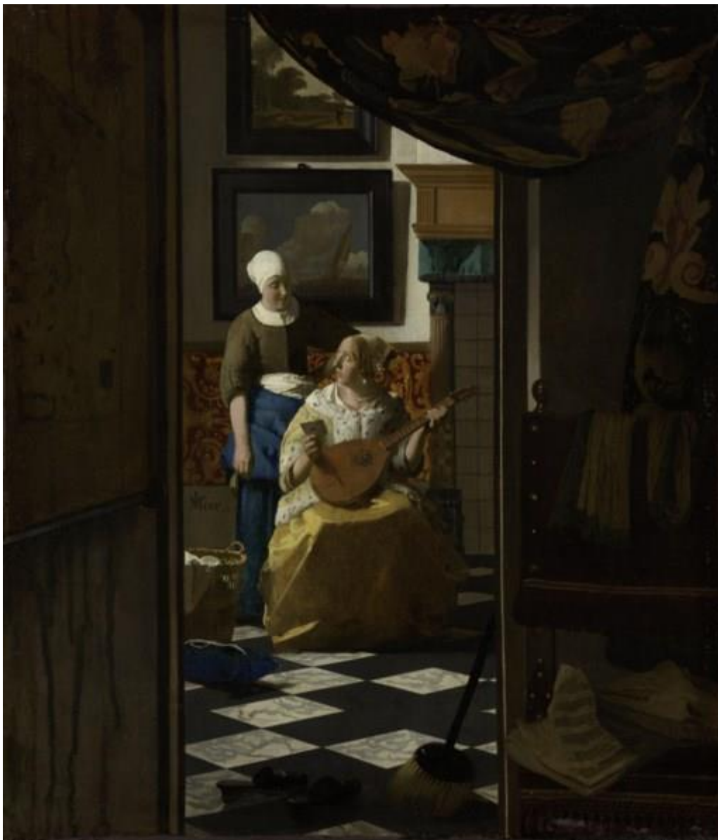
De liefdesbrief van Johannes Vermeer.